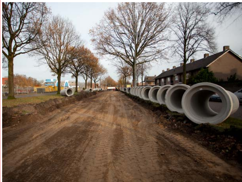
Met de rioolheffing financiert de gemeente onder andere de aanleg van nieuwe riolering.

De prijs voor een rijbewijs gaat omlaag van € 57,40 naar € 38,48. Enkele vergunningen worden wel extra duurder, omdat de gemeente er meer werk mee heeft. De aanvrager betaalt dan de extra kosten. De grondprijzen voor woningen blijven hetzelfde.